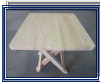
②折りたたみテーブル