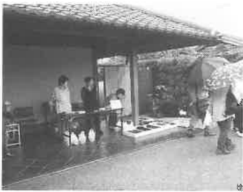
「むべの会」による花の配布