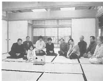
日本伝統「引仮名口(ひきかなぐち)銘鶯保存会」と来苑者の皆さん