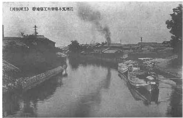
三州瓦本場新川工場地帯

三州の粘土瓦の発祥について述べますと、鎌倉時代に渥美半島の伊良湖岬で奈良の東大寺の瓦が焼かれており、室町時代に入り初めて三州瓦の瓦祖とも言われるような人が出たと考えられていますが、史料的に証明されてい