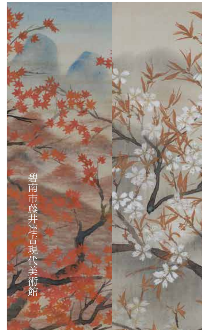
碧南市藤井達吉現代美術館