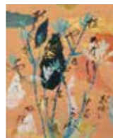
《縹色紙(ゆめのごと)》

藤井達吉(1881～1964)は愛知県碧海郡棚尾村(現・碧南市)出身の美術工芸家。工芸の各分野から図案、絵画に至るまでジャンルを横断する仕事をし、明治時代の終わりから大正時代にかけて、時代の先端を行く芸術家として活動しました。晩年には小原の和紙工芸や瀬戸の陶芸等、故郷での後進育成にも尽力しました。