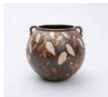
《七宝猫柳文鈿花生》