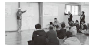
反省会(ふりかえり)

2月23日碧南市新川小学校で開催された「災害への備えを学ぶ会(災備会)」による避難所の開設と運営訓練取材しました。 当日は東南海地震を想定し、災備会のメンバーの仲間や地域の方々約70名の参加協力を得て実施されました。 避難所となる新川小学校体育館では参加者が各班に分かれ、昨年作成した「碧南新川地区避難所マニュアル」に沿って進められました。 狙いは参加者全員が実践を通して、「防災コンテナの中身を確認する」「備えておくべき備品を確認する」「マニュアルを検証する」ことです。そして訓練・体験を通して気づいたことを自分たちの備えに反映させることです。 訓練の最後に今回の課題を班ごとにまとめ発表しましたが、皆さんの課題・意見が出されました。災備会ではこの意見をマニュアルへ反映させ更に良くしていくとのことでした。 半日の訓練でしたが、参加者から「今後も積極的に参加したい」との声が沢山上がっていました。