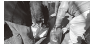
発電機で非常電源確保