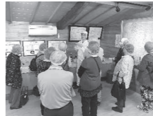
(九重味淋株式会社)