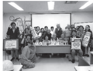
(伊藤忠製糖株式会社)