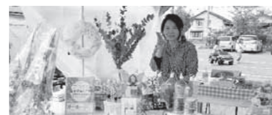
(Coeur De Maman～ママの思い～)