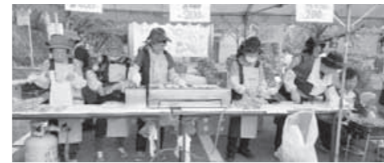
(フッチーぼたる会)

当日は眩しい程の晴天に恵まれ爽やかな風も心地よく、新鮮野菜の特売・手作り作品の販売や新施設の油ヶ淵水辺公園が周遊出来るなど新しい楽しみも加わり、たくさんの方で賑わっていました。会場となる応仁寺・無我苑や油ヶ淵水辺公園では西端まちづくりを支える団体・ボランティアの皆さんがこのイベントを盛り上げていました。サポプラに登録されている団体さんも盛り上げ隊に参加し、マルシェへの出店、パフォーマンス、大道芸等々で活躍され、周りには自然にお客さんの笑顔の輪が出来ていました。私も取材目的でウオークラリーに参加、各会場での演奏・大道芸やおいしい食べ物に惹かれ、時間を忘れとっくとも楽しんでひと時でした。