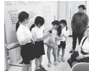
子ども商店街について話し合い