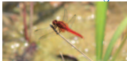
△ショウジョウトンボ

なかでも、一際大きく黄緑と水色のきれいなギンヤンマ、目が覚めるような真っ赤なショウジョウトンボや小さなイトトンボなどは、来館者にとっても人気があります。産卵する姿も見られ、新しい命も受け継がれているようです。この晩夏に、ビオトープのトンボたちをぜひ探しに来てください。