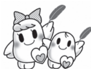
△愛ちゃんと希望くん

今年も10月1日(火)～12月31日(火)に、赤い羽根共同募金運動が始まります。連絡委員や民生委員の皆さんがお願いに伺います。たくさんの方のやさしさが共同募金を支えています。ご協力をお願いします。