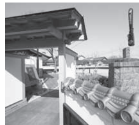
△陣屋跡に整備された大浜陣屋広場（羽根町）