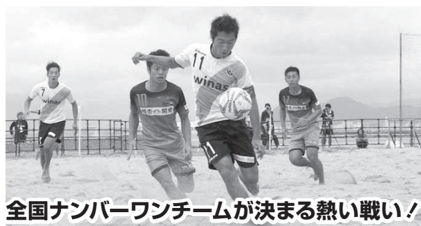
全国ナンバーワンチームが決まる熱い戦い!