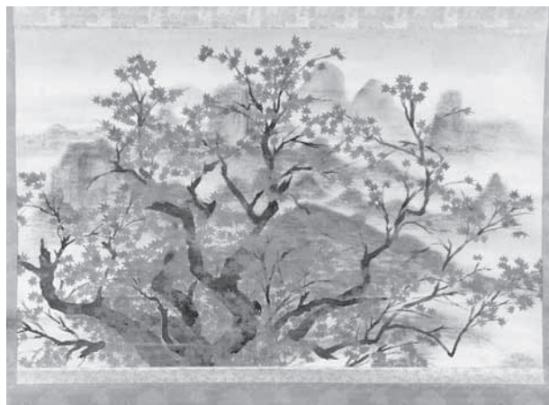
△藤井達吉《満山紅葉》昭和10年代