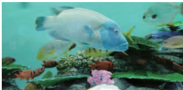
△サンゴの海の水槽は真冬でも20℃以上