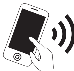
スマートフォンから送信

衣浦東部広域連合消防局では10月1日からNet 119緊急通報システムの運用を開始しました。これは当消防局管轄（碧南市、刈谷市、安城市、知立市、高浜市）に在住または通勤・通学中の人で、聴覚または音声・言語機能などに障害があり、音声による119番通報が困難な人が、お持ちのスマートフォンなどからインターネット回線を利用して、音声を用いることなく119番通報するシステムです。利用には事前登録が必要です。詳しくは衣浦東部広域連合消防局のホームページで確認してください。