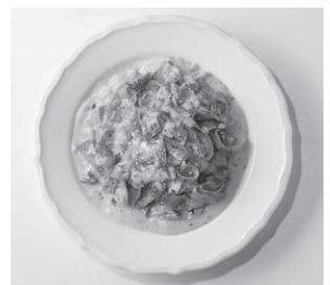
△にんじんカルボナーラ