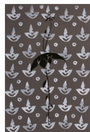
△藤井達吉『創作染織図案集』より