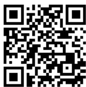
変更用 QR コード

QR コードを携帯電話のバーコードリーダーで読み取るか、直接次のアドレスを入力してください。