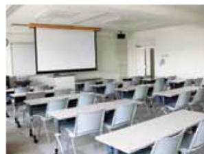
視聴覚室 [机15・イス30]