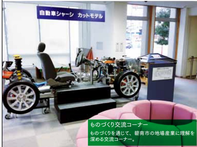
ものづくり交流コーナー ものづくりを通じて、碧南市の地場産業に理解を深める交流コーナー。