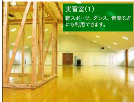
実習室(1) 軽スポーツ、ダンス、音楽などにも利用できます。