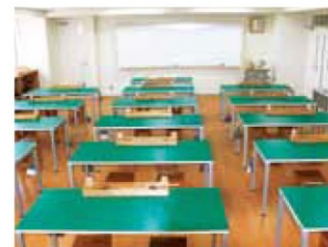
製図室(碧南市青少年少女発明クラブ工作室) [机16・イス32]