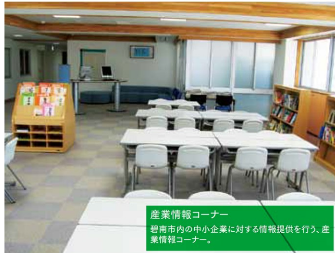
産業情報コーナー 碧南市内の中小企業に対する情報提供を行う、産業情報コーナー。