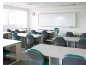
コンピュータ室 [机12・イス24]