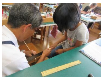
アイデア工作教室