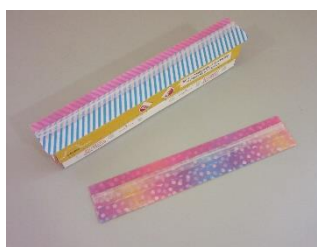
碧南市創意くふう展