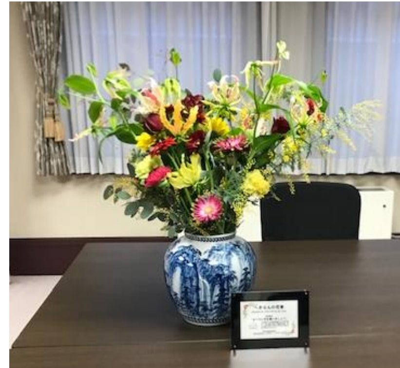
副市長が愛知県青山副知事に「へきなんの花束」をPRしたときの花束（令和3年2月17日）