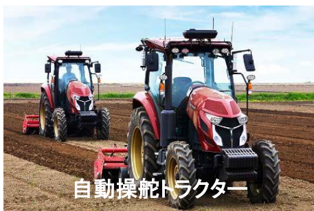
自動操舵トラクター