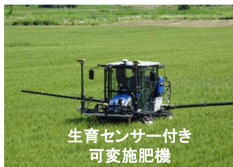
生育センサー付き 可変施肥機