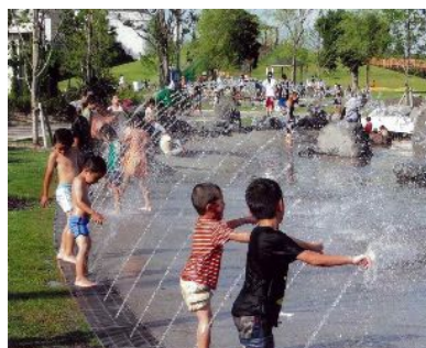
「楽しい噴水遊び」 (浜町：碧南市臨海公園) 神谷正巳