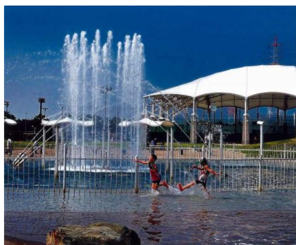
「子供の樂園」 (浜町:碧南市臨海公園) 神谷芳夫