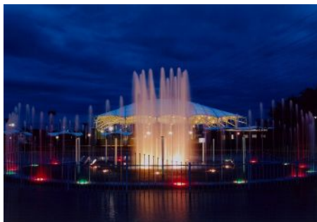
「水と光の鏡演」 (浜町：碧南市臨海公園) 犬塚 猛