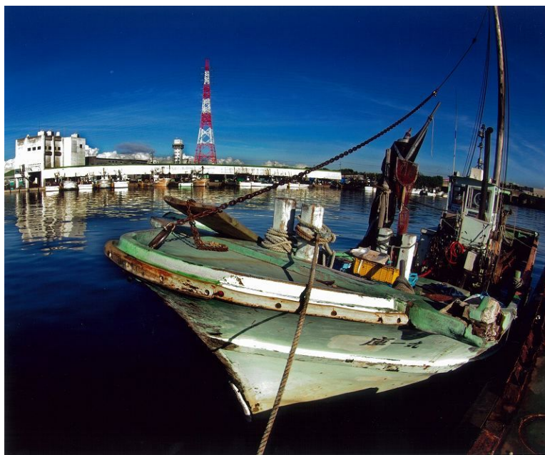
「早朝の大浜」 (大浜漁港) 勝呂嘉裕