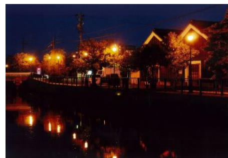
「夜の堀川端」 (錦町：堀川) 板倉重春