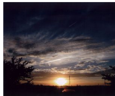
「碧南市の夕やけ・・・」 (鷺林町) 小久江正博