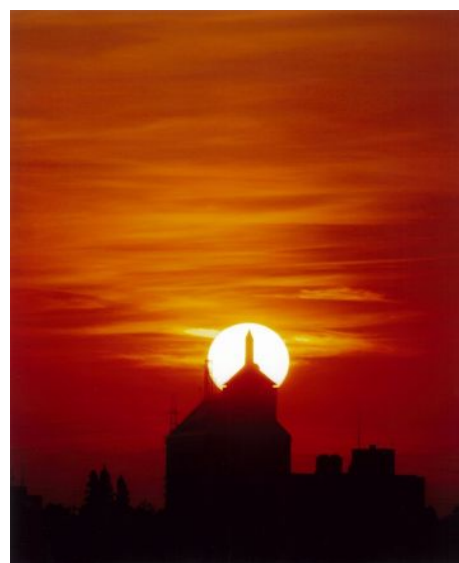
「夏焼け空」 (市役所) 杉浦和行