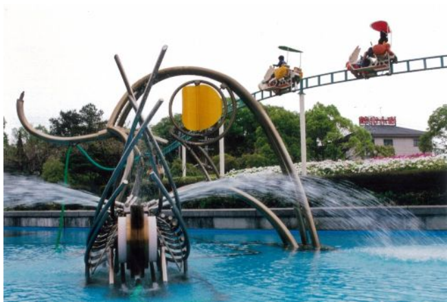
「明石パーク」 (明石町：明石公園) 井澤昭一