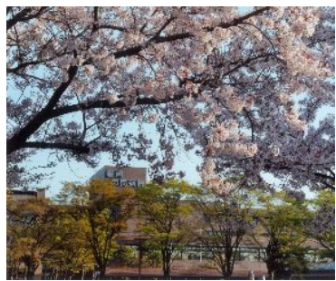
「朝の光」 (平和町：碧南市民病院) 入倉喜巳男