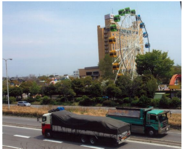
「幹線と公園」 (明石町：国道247号と明石公園) 鈴木 勇