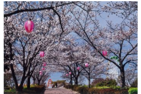
「桜花爛漫」 (松江町：明石公園) 板倉重春