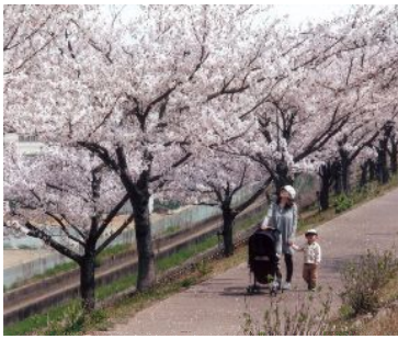
「矢作川つつみの桜」 (鷺林町：矢作川桜つつみ) 杉浦幸雄