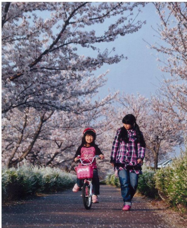
「春うらら」 (鷺林町：矢作川桜つつみ) 岡本茂義