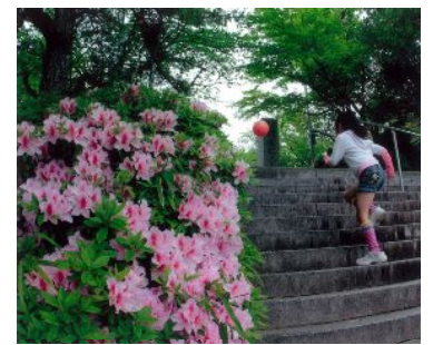
「応仁寺で遊ぶ」 (油渕町：応仁寺) 鈴木あき子