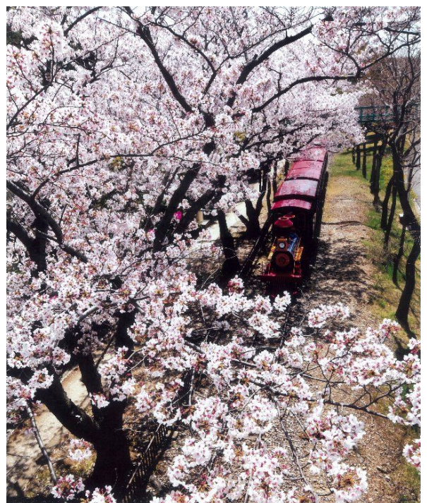
「桜のトンネル」 (明石町：明石公園) 稲垣新二