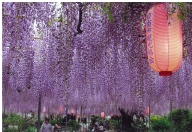
「香りいっぱい藤いっぱい」 (二本木町：広藤園) 新実 東