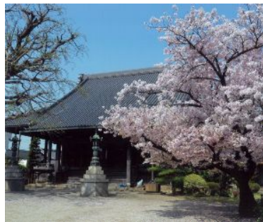
「寺と桜」 (築山町：本傳寺) 神谷正巳