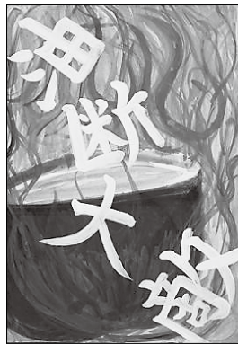
△杉浦瑠生さんの作品