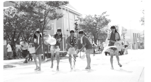
△元気ッス！へきなんでの打ち水