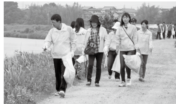
△クリーンピーでの清掃活動