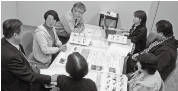
△へきなん市民環境会議定例会

へきなん市民環境会議では、一緒に活動できる仲間を募集しています。市内在住・在学・在勤の人で、環境に興味のある人ならどなたでも参加できます。詳しくは環境課へお問い合わせください。