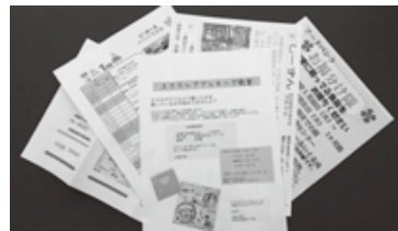
サポプラにてチラシ掲示