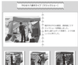
活動報告を情報発信