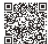
△ひと育ナビ・あいちQR