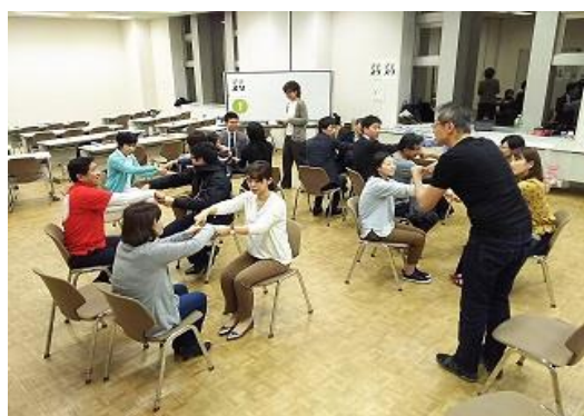
まちづくりの担い手育成講座