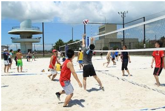
碧南ビーチバレー大会