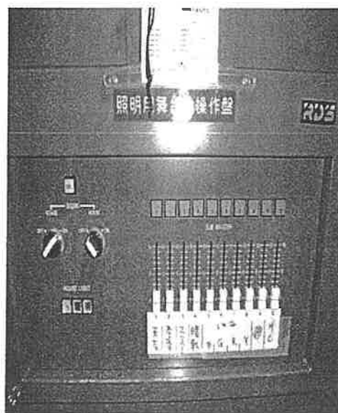
エメラルドホール照明舞台袖操作器