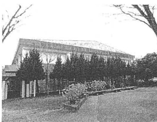
西端中学校体育館