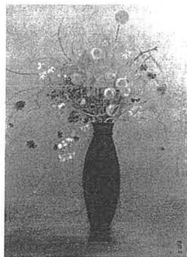
藤井達吉《静物・花》1920年 碧南市藤井達吉現代美術館蔵

(3) 内 容 私たちは新型コロナウイルスの感染拡大という未曾有の出来事を経験し、〈いのち〉のはかなさと、その重みを否応なく実感した。本テーマ展は、〈こころ〉と同様、平明な言葉でありながらも、私たちに深い洞察を求める〈いのち〉について考えるために開催する。