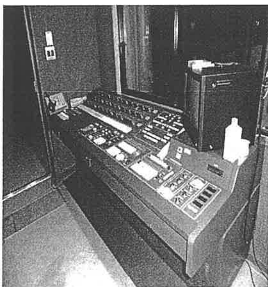
エメラルドホールメイン照明操作卓

エメラルドホール及びシアターサウスのメイン照明操作卓、舞台袖操作器（リモート操作器）、ワイヤレスシステム等の更新工事を行うことにより照明機能の回復を図る。