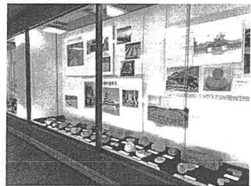
〔 企画展展示例 : 令和元年度文化財展「三河での瓦づくり 伝承と歴史」 〕