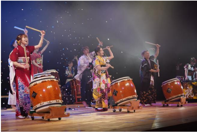
二十歳を祝う会 「和太鼓」