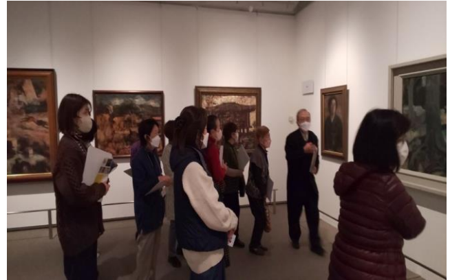
女性団体視察見学「藤井達吉現代美術館」