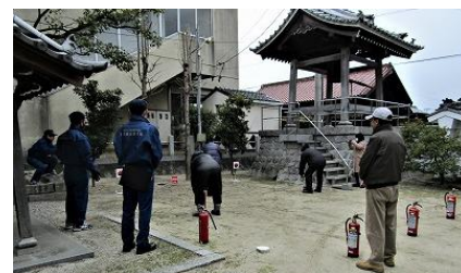
文化財防火デー行事