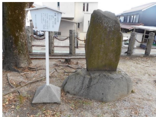
昭和25年、碧南市観光協会が建立