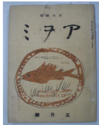
俳誌「アヲミ」の表紙 題字：高浜虚子 絵：藤井達吉

また、藤井達吉も「アヲミ」の表紙絵を描き、文を寄稿するなど故郷を励まし続けました。そのため、棚尾地区は俳句が盛んとなり、現在も数多くの句碑が残っています。