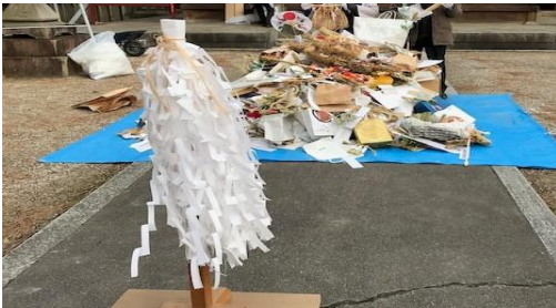
お祝い前の御神札など(毎年1月第2土曜日実施)

1月15日(土)八柱神社でお焚き上げ神事が行われました。1年間お世話になったお神札やお守りに宿られている神様に元のお社にお帰り頂く神事です。