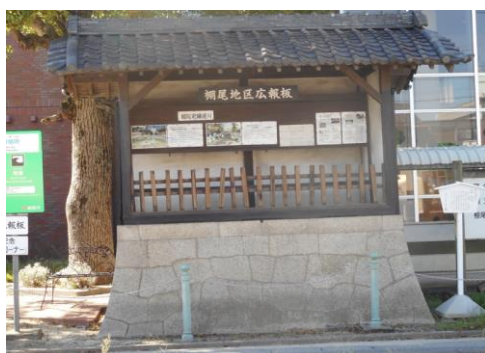
公民館北側にある高札舎