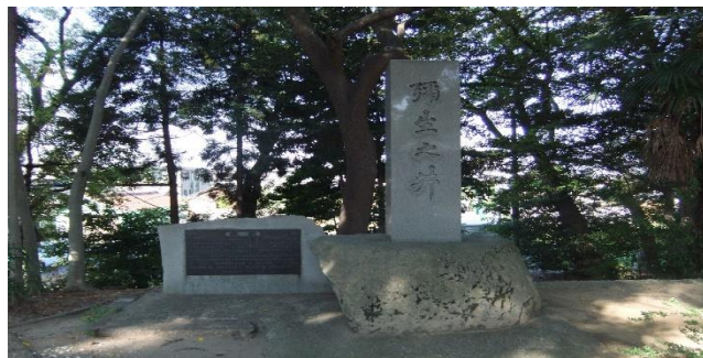
八柱神社境内にある石碑