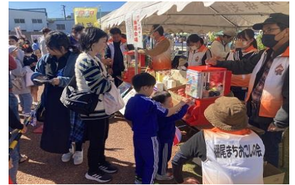
笑顔溢れるガチャガチャ抽選会