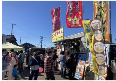
キッチンカーコーナー也大盛況