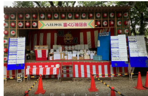
豪華な富くじ景品の山