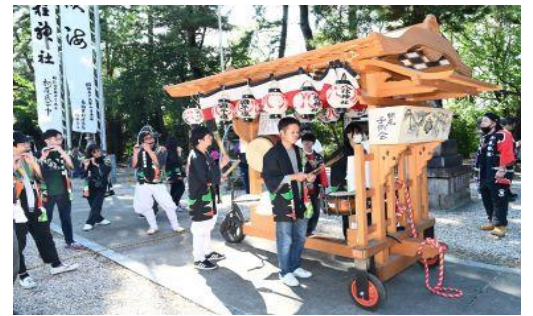
地区内巡行後、拝殿前でチャラボコ奉納