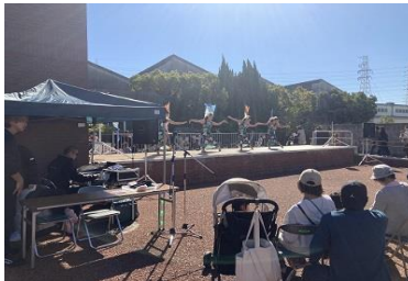
見応えあるステージショー

たなを村まつりへの協賛金はガチャ景品や看板等備品の購入に活用させて頂きました。また、南中生徒のボランティア(スタッフ活動)の参加にも改めて感謝いたします。