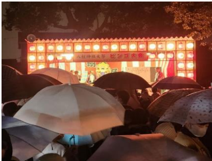
雨天でも大盛況のビンゴ大会