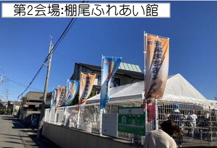
第2会場:棚尾ふれあい館