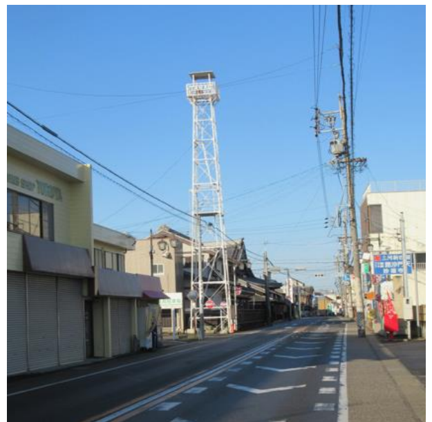
耐震工事(平成29年度)後、現在の写真