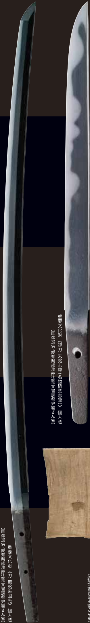
重要文化財 《短刀 朱銘志津(名物稲葉志津)》 個人蔵