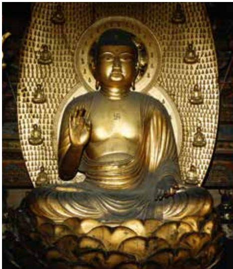
重要文化財 《木造阿弥陀如来坐像》 海徳寺蔵(パネル展示)