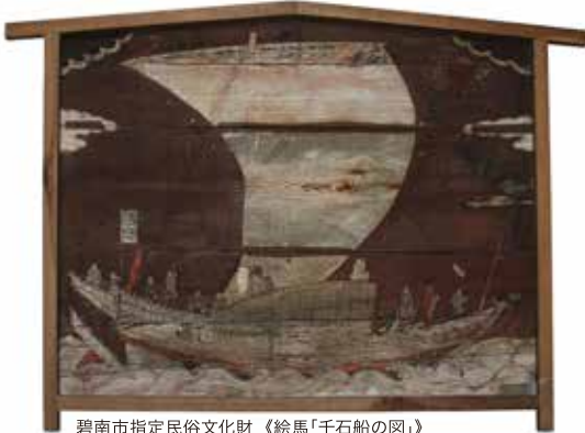
碧南市指定民俗文化財 《絵馬「千石船の図」》 (「白山社 絵馬群」十四面のうち) 白山社蔵