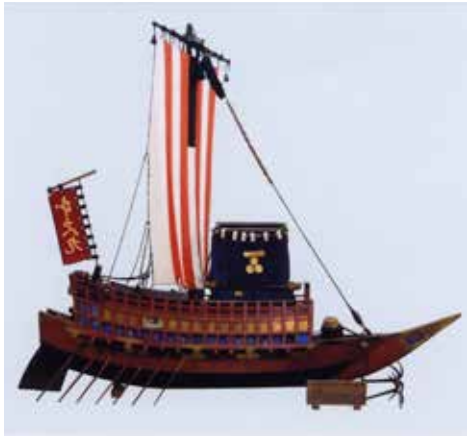
碧南市指定民俗文化財 《御座関船雛形 本宮丸》 (上の宮)熊野神社蔵