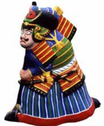
三河土人形 高山八郎作 (元 碧南市指定無形文化財保持者)