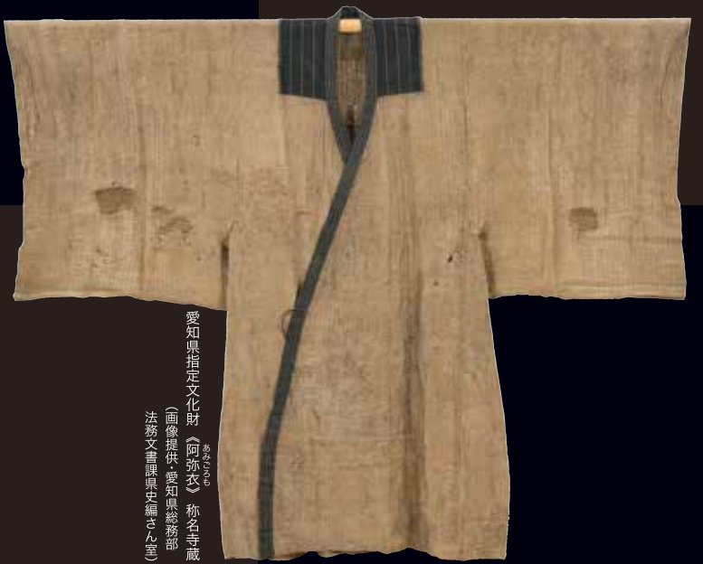
愛知県指定文化財 《阿弥衣》 称名寺蔵