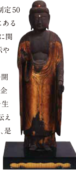
碧南市指定有形文化財 《木造阿弥陀如来立像》 西方寺蔵

こうした機会だからこそ公開される文化財もあり必見の企画展。碧南の歴史のなかで生まれ、育まれ、今日まで守り伝えられてきた貴重な文化財を、是非ご覧ください。