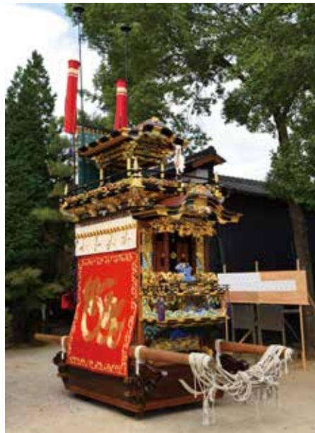
碧南市指定民俗文化財 《鶴ヶ崎区 山車》 鶴ヶ崎区蔵(パネル展示)