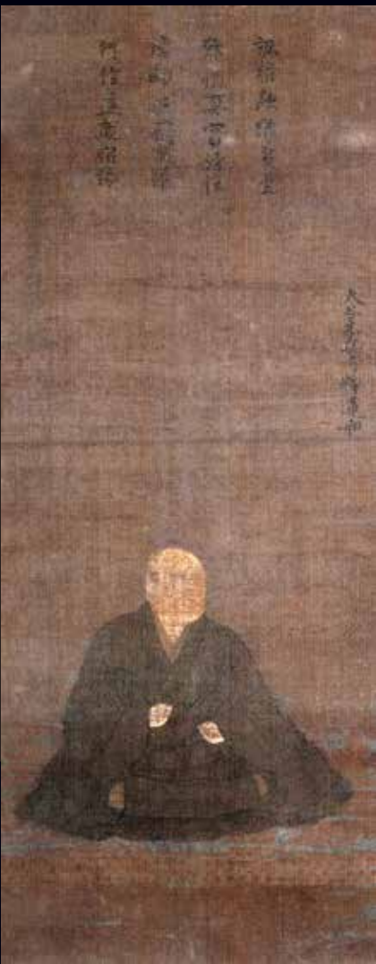
碧南市指定有形文化財 《絹本着色蓮如上人肖像》 應仁寺蔵(碧南市寄託)