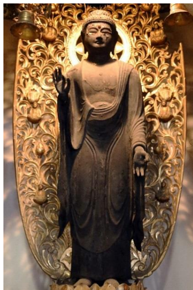
木造阿弥陀如来立像 1 軀

本像の着衣表現から、平安末期から鎌倉初頭期に多くみられる三尺阿弥陀立像である。本像の腹部、大腿部及び裾の衣文が比較的浅く平行状に整えられており、平安後期彫刻の余風を色濃く残しながらも、面貌、体軀及び背面の充実した起伏には鎌倉彫刻の写実味がすでにあらわれている。おそらく京風（定朝様）及び奈良風（初期慶派様）折衷の立場に立った作例とみるべき13世紀初めにも近い三尺阿弥陀立像として貴重である。