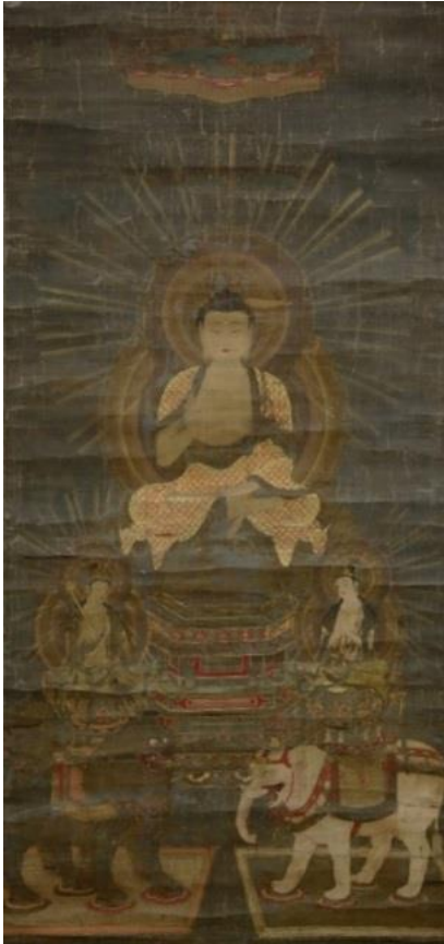
絹本着色釈迦三尊像 1幅