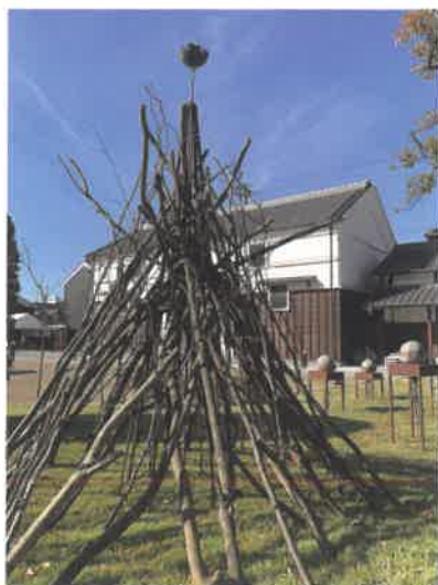
「ハジマリとキオクの風景」 2019

これまで金属を中心に様々な素材や技法を 用い、立体造形・空間表現を行なってきた。 そして今、ここに在るものと出会い、触れ、 感じながら、様々な素材と向き合う。 造形表現に生まれかわる過程を大切に しながら、新しく生まれる現象を探究する。