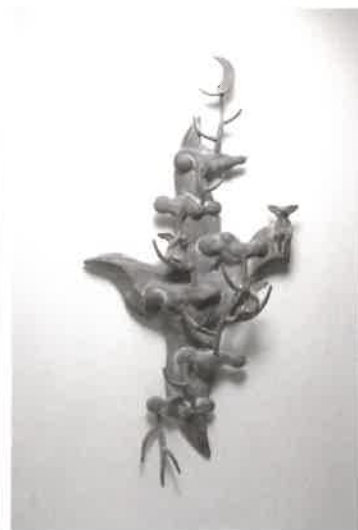
「森に居くノバタキ」 2009

この度、このようなタイミングで、故郷である碧南市の無我苑 瞑想回廊にて展覧会をさせていただけること、感謝の気持ちと ともに、何か深いご縁を感じております。