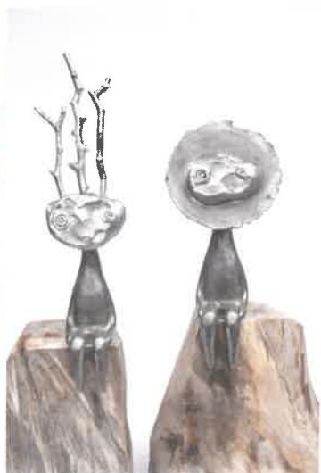
「此処に在る時間と記憶」 2019