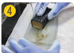
4 サンドペーパーで形を整える