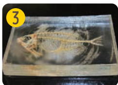
3 特殊な樹脂で骨格を封入して固める