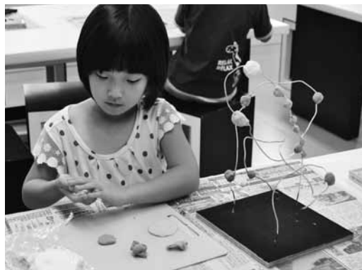
針金と粘土の表現