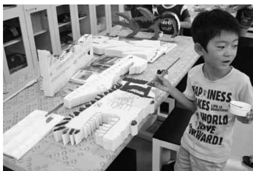
スチロールでつくるでっかい魚