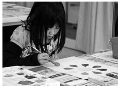
基礎講座～絵具を混ぜる・塗る～

以上のように一つひとつ分類してみると、実施プログラムの進め方や細かな内容に反省点は多々あるものの、美術館が実施するワークショップとして、今後も発展・展開していくことができるものも多くあると言えよう。分類することで運営側の目的意識もより強く明確になる。重要なのは、過去に実施してきたプログラムが何であれ、参加する子どもたちにとって楽しく、発見や学びのあるものであったかどうか、そして講師や運営側が実施する際に常にそれを意識できているかということではないだろうか。