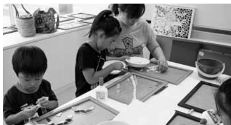
モザイクタイルアート