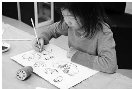
季節の野菜や果物を描こう