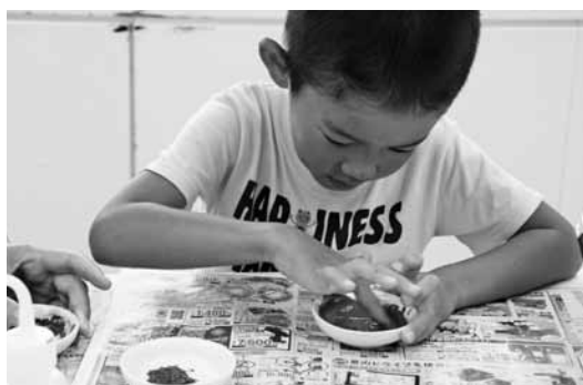
日本画で描くうちわ