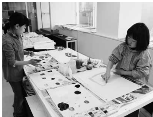
指を使って描いて