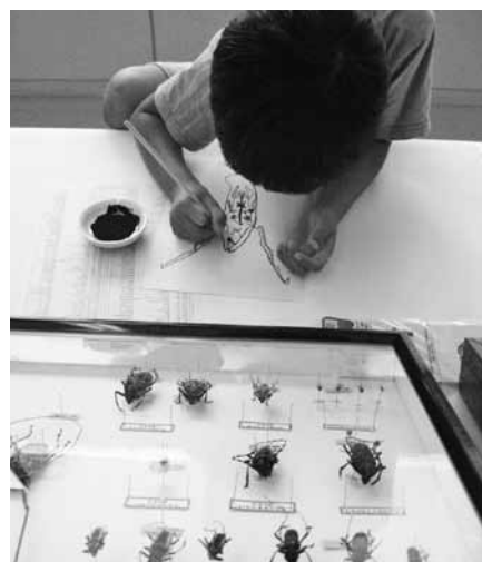
昆虫を写生しよう