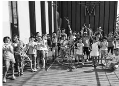
枝とひものまきまき造形