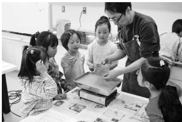
銅のいぶしレリーフ