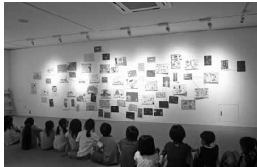
みんなで描こう！ジャンボ連想画