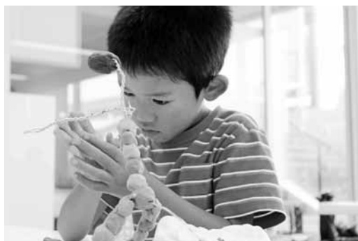
不思議なまるまる動物