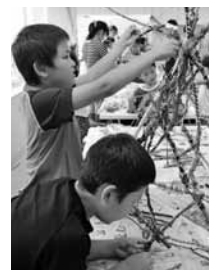
枝とひものまきまき造形