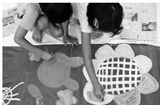
美術館のパナーを描こう