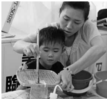
小原和紙で作る飾り皿