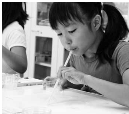
バブルペインティング