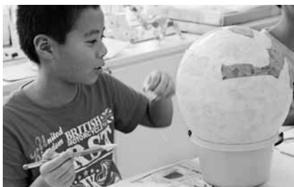
小原和紙の風船ランプ