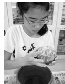
小原和紙の小物入れ