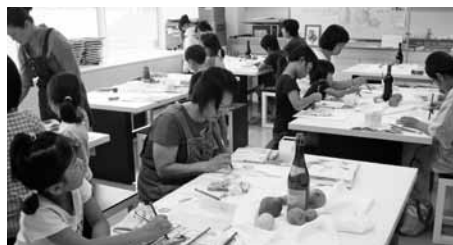
水彩画で描く静物画