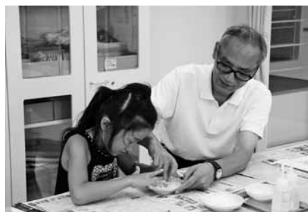
親子で日本画に挑戦