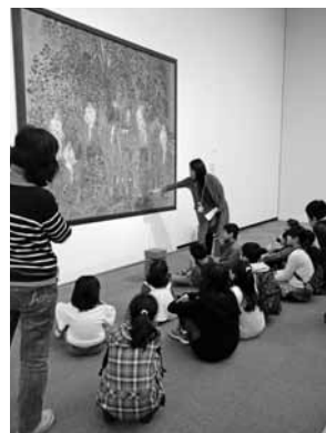
美術館見学バスツアー