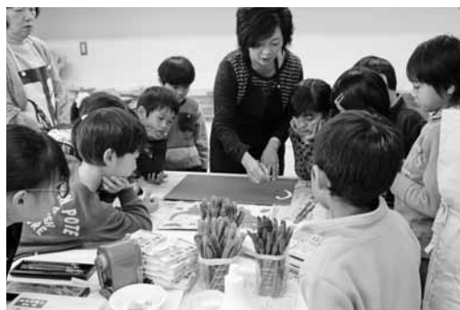
赤い紙に赤い絵・青い紙に青い絵