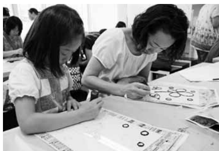
ステンドアクリル