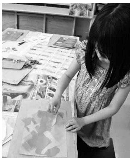
絵の具の表現いろいろ