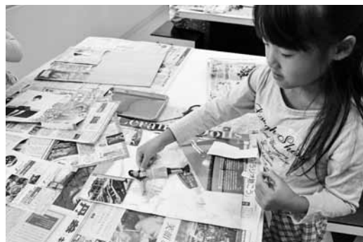
自分を貼り込むコラージュ