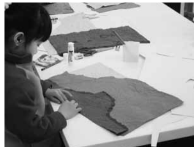
和紙の継紙技法に挑戦