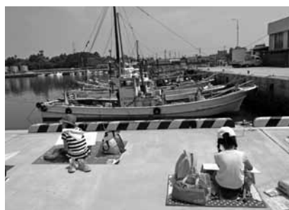
大浜漁港で船を描く!