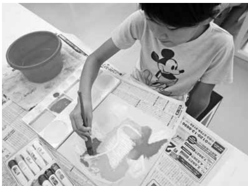
こすりだしアート