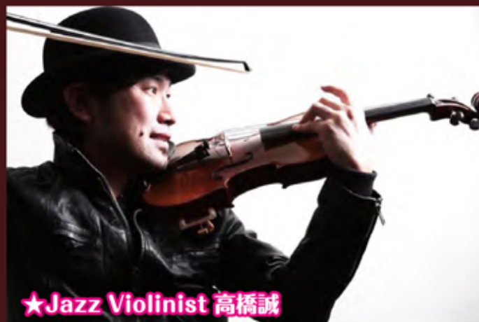
★Jazz Violinist 高橋誠