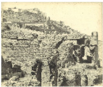
1.《サグント》(写真) 三之瀬御本陣芸術文化館蔵、2.《サグント劇場跡》 三之瀬御本陣芸術文化館蔵 1922年～23年、3.《椿》 姫路市立美術館蔵 1932年、4.《山姥》京都国立近代美術館蔵 1948年、5.《犬》 東京国立近代美術館蔵 1950年、6.《八幡平》 京都市美術館蔵 1954年、7.《窪八幡》 東京国立近代美術館蔵 1955年