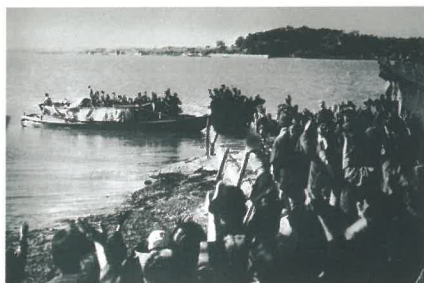
戦時中の森前の渡し ギャラリー彦六蔵