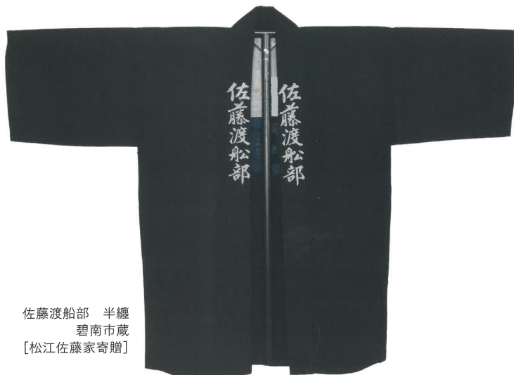
佐藤渡船部 半纏 碧南市蔵 【松江佐藤家寄贈】

碧南市源氏神明町4番地 | ☎ 0566-42-3511 | 名鉄三河線 碧南中央駅下車、東方向へ徒歩約10分