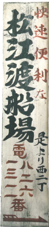
渡船場看板 碧南市蔵【松江佐藤家寄贈】

そこで本展では、衣ヶ浦をつないでいた渡船、そして関連する交通網の変遷について、松江渡船の資料を中心に紹介します。