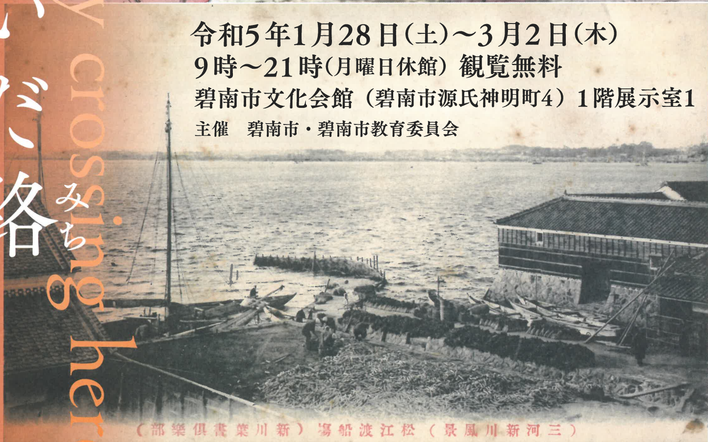
(部樂俱書葉川新) 場船渡江松 (景風川新河三)

令和5年1月28日(土)~3月2日(木) 9時~21時(月曜日休館) 観覧無料 碧南市文化会館 (碧南市源氏神明町4) 1階展示室1 主催 碧南市・碧南市教育委員会