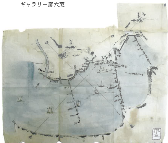
海辺絵図面汐深井ニ三州迄之町数覚（部分）