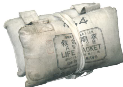
亀崎丸救命胴衣 碧南市蔵【松江佐藤家寄贈】